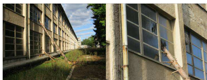
Nevrijeme u rujnu zahvatilo je i okoliš Adriadiesela. Jak vjetar srušio je brojna stabla, od kojih je jedno završilo i u našoj teškoj strojnoj obradi.

Na dan 30.09.2012.godine zaposleno je 249 radnika od toga je 9 radnika sa ugovorom na određeno vrijeme.